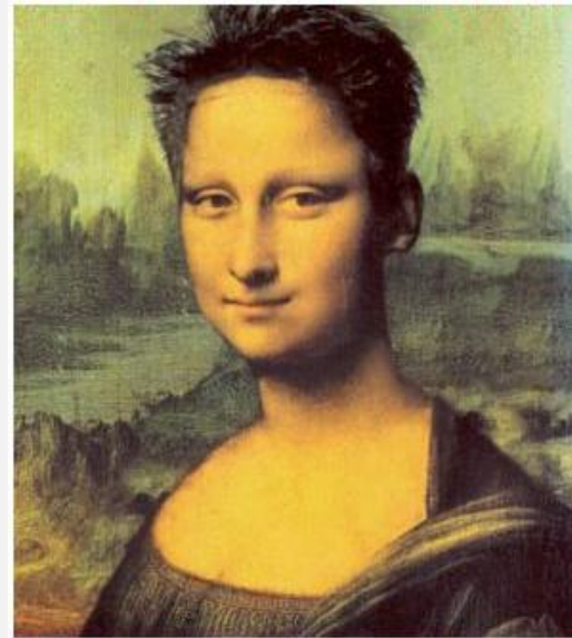
La Joconde relookée