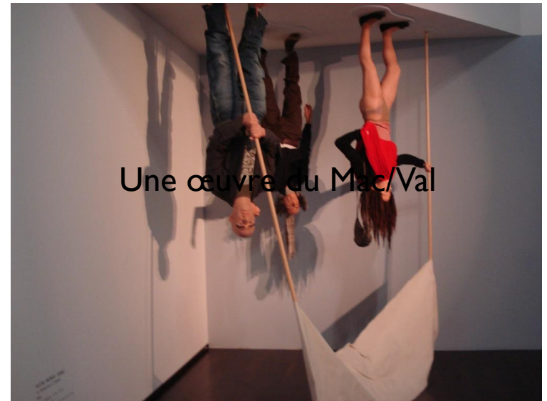
Une œuvre du Mac/Val