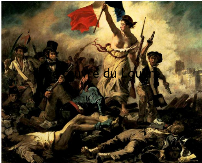
Une œuvre du Louvre