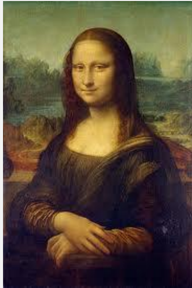
La Joconde, Léonard de Vinci, Réalisé entre 1503 et 1506

Adaptons les activités sans les remplacer