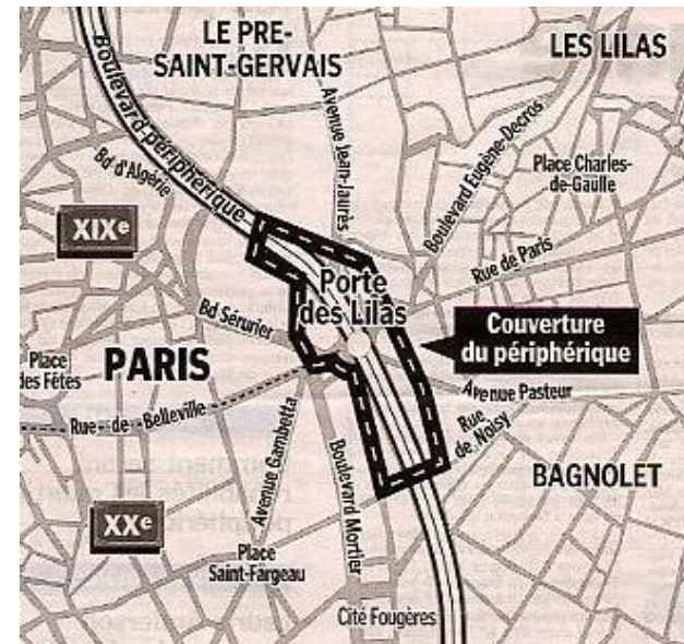
Balade en banlieue